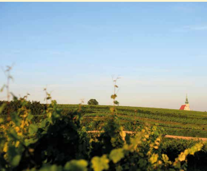
Blick auf Poysdorf

Erleben Sie das Weinviertel und die Weinbauregion Wagram hautnah. Inmitten der Natur spüren Sie die Vielfalt der Landschaft und die genussvolle Gelassenheit der Region. Die Weite der Landschaft und der Weg entlang malerischer Weingärten machen den Jakobsweg Weinviertel zu jeder Jahreszeit zu einem besonderen Erlebnis. Großartige Blicke ins Weinviertel gibt es am Michelberg, unvergessliche Aussichten in die fruchtbare Weinlandschaft können Sie bei der Gebietsvinothek in Kirchberg genießen.