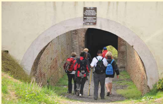
Pilger beim Störwegtunnel, Hausleiten