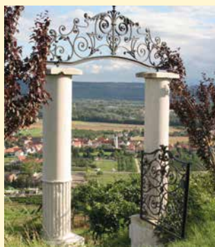
Heinz Conrads-Tor, Rohrendorf

Der gesamte Streckenabschnitt beträgt 152 km und ist in 6 Tagesetappen zu je durchschnittlich 25 km zu begeben. Sie können selbstverständlich auch andere Tagesetappen wählen.