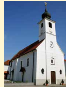
Jakobskirche Brunn im Felde